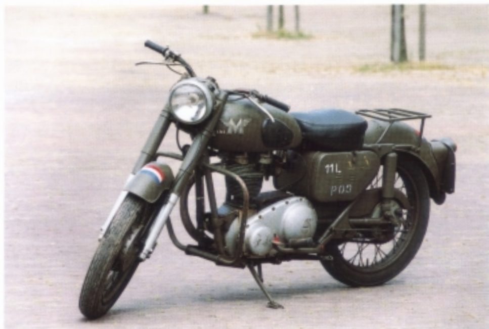
afb. 87/1. Matchless G3 (inv. 051859) afmet. 219x71x200 cm; gewicht: 172 kg; motor: 16 pk; cilinderinhoud: 350 cc.